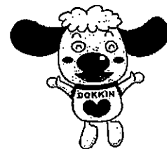
公正取引委員会 キャラクター どっきん